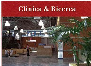
Clinica & Ricerca