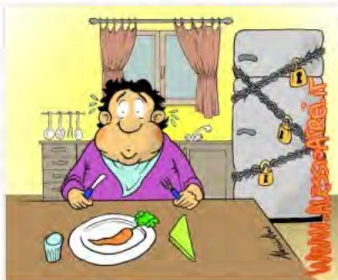
DIETE FAI DA TE Le donne italiane non ascoltano il dietologo

Le donne italiane si pentono. Dopo le grandi abbuffate natalizie, un milione di donne sono pronte a mettersi a dieta. E' quanto emerge dalla ricerca commissionata dal periodico Starbene, su un campione di donne tra i 25 e i 64 anni. Pranzi, cene e brindisi fanno incrementare il peso delle italiane, le quali però non si disperano: sono pronte dopo il cenone di Capodanno a correre ai ripari. Il 40% di loro inizierà una dieta fai da te consultando siti internet, ascoltando i consigli delle amiche o leggendo riviste, il dietologo invece, raramente è chiamato in causa. Le donne italiane non si preoccupano minimamente delle ripercussioni che il "fai da te" può avere sulla loro salute. Iniziano la dieta dopo il cenone di fine anno le signore tra i 35 e i 44 anni, ma anche le adolescenti, appena si vedono con qualche chiletto di troppo o qualche vestito che non sta più bene, ricorrono subito ad un regime dietetico. La situazione però tende poi a peggiorare nel momento in cui si ricorre al digiuno totale: dati alla mano, una tenn egers su cinque, ha provato una dieta dimagrante, ma solo il 32% di loro si è rivolto ad un medico. E viene spontaneo chiedersi come si possa pretendere che i giovani di oggi siano abituati a consultare un dietologo, se nella famiglia non trovano sicuramente un buon esempio da seguire. E così il 35% degli adolescenti (43% fra le ragazze) ha provato o portato a termine una dieta fai da te. I giovani fanno ricorso ai mezzi tecnologici (vedi i numerosi blog