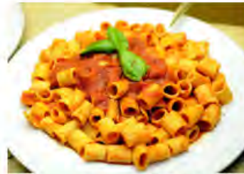
1 di 1

Raramente si ricorre al dietologo. E' quanto emerge da una ricerca su un campione di 650 donne tra i 25 e i 64 anni, commissionata dal periodico Starbene.